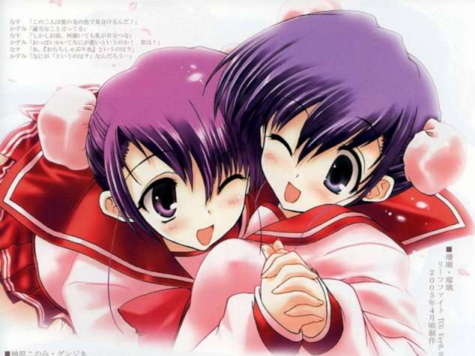
■ 瑞樹・瑞樹 リーフファイト TCG Ver.6.00 2005年4月増制作

なす 「この二人は髪の色で見分けられるんだ！」 かずみ 「面白いこと言ってる」 なす 「しかしお前、何言っても乳が目立つな」 かずみ 「おっぱい隠して友達が悪いというのか！ 罪は！」 なす 「あ、『おもちしゅぷりぬ』というのほや？」 かずみ 「なにが『というのほや』なんだろうー」